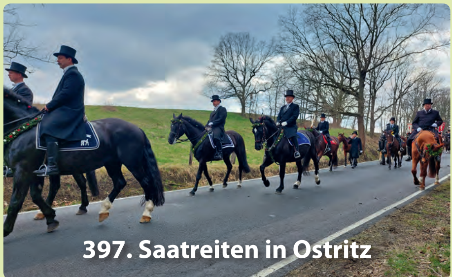
397. Saatreiten in Ostritz