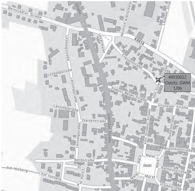
Abbildung 1: Lage der Grundwassermessstelle Ostritz