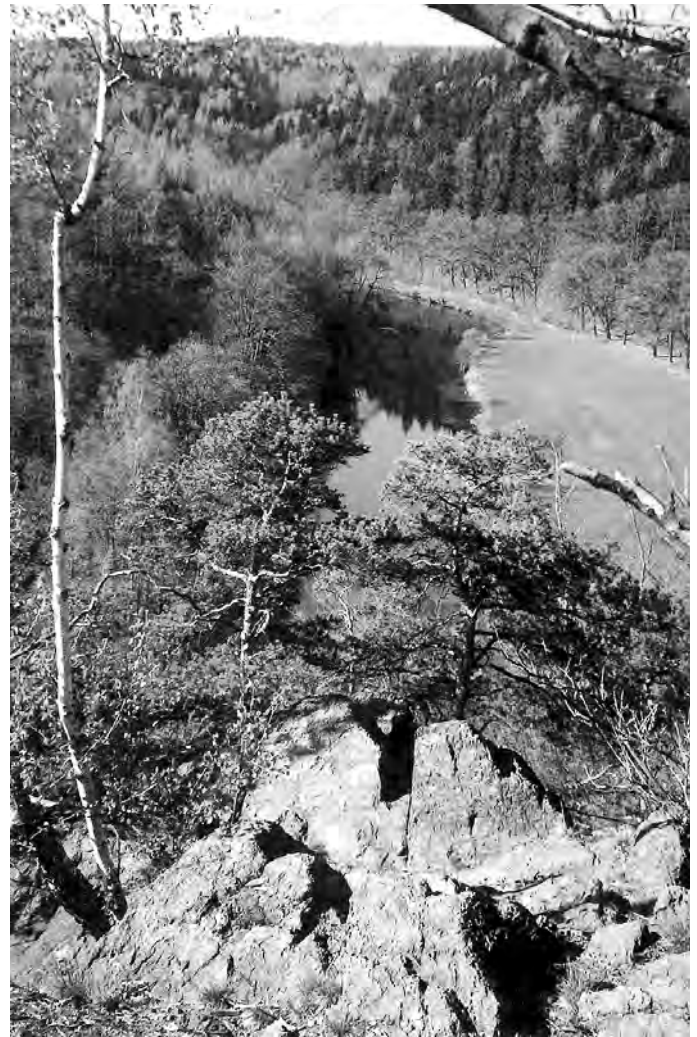
Das Neißetal zwischen Rosenthal und dem Kloster St. Marienthal